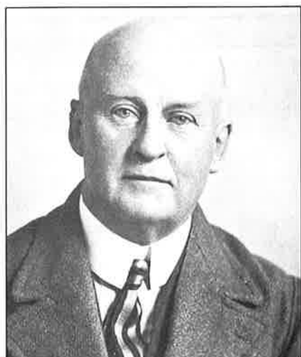
Pim Mulier: Vader van alle Sporten

Pim Mulier werd uit gefortuneerde ouders op 10 maart 1865 in het Friese Witmarsum geboren. Twee jaar later verhuisde de familie naar Haarlem. Daar kreeg Pim Mulier in de loop der jaren Nederland aan het sporten. Belangrijk daarbij waren de ervaringen die hij opdeed tijdens zijn verblijf op kostscholen in