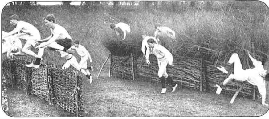
Crossen/Steeple Chase rond 1920